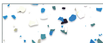
25 Värihiutale (sininen-musta-valkoinen)