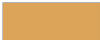
20 (NCS S2060 Y20R)*