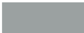
17 (NCS S2502 B)*