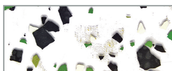
14 Värihiutale (vihreä-valkoinen-musta)